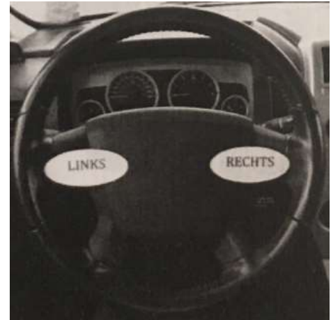
Figuur 1 - Links en rechts op het stuur