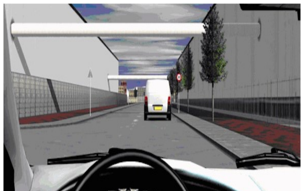
Figuur 1 - Lesonderdeel van de rij simulator

Voorafgaand op de eerste rijles in het verkeer, kan er gekozen worden om eerst lessen te nemen in een rijvaardigheidscentrum. Dit is een rij simulator waarbij verschillende verkeerssituaties kunnen worden gecreëerd, waarin het aan te leren onderdeel goed kan worden ingeoeffend. In een lesauto moet je alles tegelijk doen, terwijl het rijproces in een rij simulator kan worden opgedeeld.